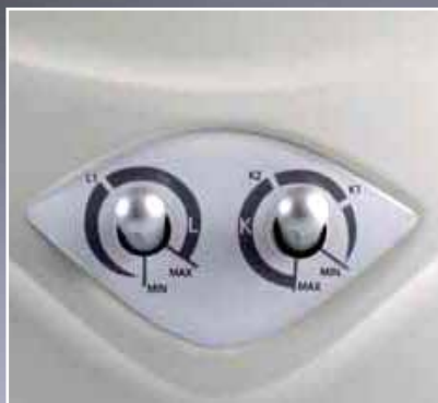
Potentiometer Lux & Kelvin